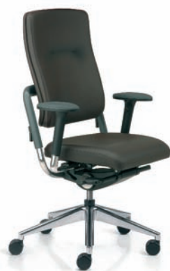
XE512809 / KST8/A63/80/HFC