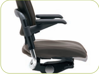
Die serienmäßige Sitzneigeverstellung beträgt 0° und 4° Vorneigung.