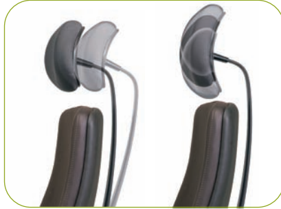
Die Kopfstütze (KST8) ist in der Tiefe einstellbar und in der Höhe rasterverstellbar.