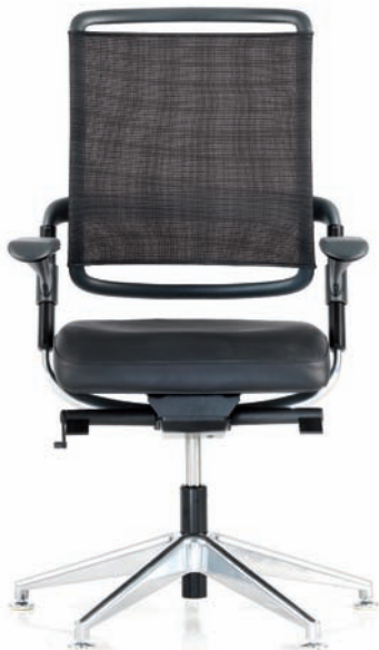
Der Konferenzsessel ist serienmäßig mit Memory-Mechanik (VBT-M) und Gleitern ausgestattet.