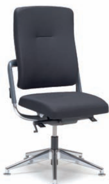
XE453109 / VBT-M/80