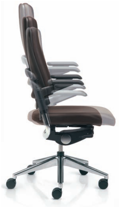
Die Kombination von Schiebesitz und schräggestelltem Rückenrahmen ermöglicht eine Sitztiefenverstellung von 10,7 cm. Der Höhenverstellbereich des Rückens beträgt 9 cm.

Das Ziel – Sitzen in Bewegung! Ein Muss – individuelle Anpassung des Stuhles an den Menschen!