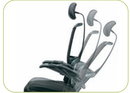
Die Synchronmechanik (Typ 51) verfügt über einen Öffnungswinkel von 93° bis 123°. Verhältnis 1:2,9.