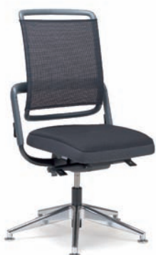
XE453067 / VBT-M/80

Genießen Sie die Kopfstütze in der Relaxposition und steigern Sie Ihr persönliches Wohlbefinden.