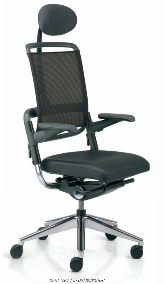
XE512767 / KST8/A60/80/HFC