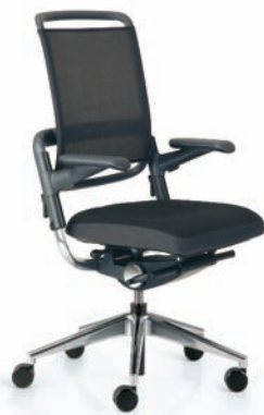
XE512767 / A60/80/HFC

Der Netzrücken unterstützt die natürliche Form der Wirbelsäule. Die optimale Druckverteilung gewährleistet höchsten Sitzkomfort.