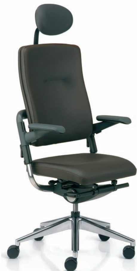
XE512809 / KST8/A60/80/HFC