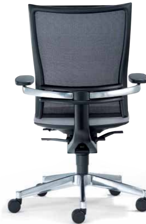
Klöber Orbit Network orb88 Drehsessel. Alu-Armbügel. Klöber Orbit Network orb88 swivel chair. Aluminium armrest bars.