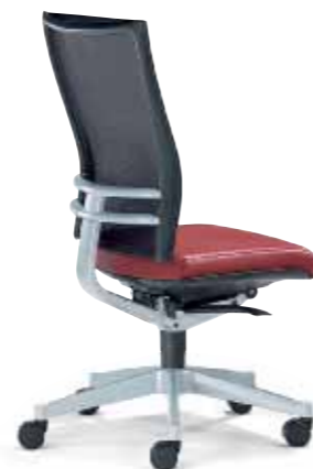
Klöber Orbit Network orb88 Drehsessel. Glasfaserverstärkter Trägerrahmen mit Softnet-Bespannung. Alu-Rückenlehnenträger und -Fußkreuz alu-farbig. Klöber Orbit Network orb88 swivel chair. Glass-fibre reinforced supporting frame with Softnet mesh. Aluminium backrest frame and aluminium-coloured base.