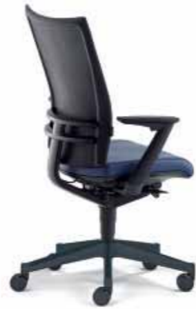
Klöber Orbit orb98 Drehsessel. Glasfaserverstärkter Trägerrahmen mit TPE-Membran. Alu-Rückenlehnenträger schwarz, Z-Armlehnen, Alu-Fußkreuz schwarz. Klöber Orbit orb98 swivel chair. Glass-fibre reinforced supporting frame with TPE membrane. Aluminium backrest frame, black, Z armrests, aluminium base, black.