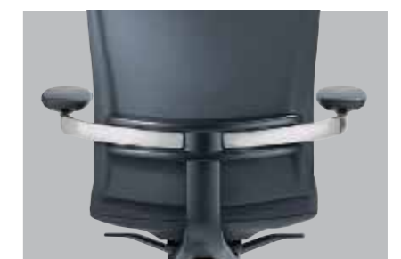
Alu-Rückenlehnenträger schwarz oder alu-farbig. Alu-Armbügel poliert oder schwarz, optional mit Lederauflage. Aluminium backrest frame with black or aluminium finish. Aluminium armrest bars, polished or black, or with leather padding.