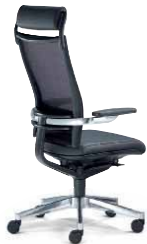
Klöber Orbit Network orb89 Drehsessel mit neigbarer Kopfstütze. Glasfaserverstärkter Trägerrahmen mit Softnet-Bespannung. Alu-Rückenlehnenträger schwarz, Alu-Armbügel und -Fußkreuz poliert. Klöber Orbit Network orb89 swivel chair with tilting headrest. Glass-fibre reinforced supporting frame with Softnet mesh. Aluminium backrest frame, black, aluminium armrest bars and base, polished.