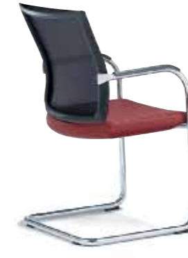
Klöber Orbit Network orb46 Freischwinger. Softnet-Rückenlehne. Armlehnen mit Kunststoff-Auflage schwarz, Armauflage optional Leder oder Ahorn natur. Rundrohr-Gestell hochglanz verchromt. Klöber Orbit Network orb46 cantilever chair. Softnet backrest. Armrests with black plastic finish, arm supports optionally with leather or natural maple finish. Tubular steel frame with polished chrome finish.