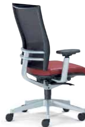
Klöber Orbit Network orb88 Drehsessel. Glasfaserverstärkter Trägerrahmen mit Softnet-Bespannung. Alu-Rückenlehnenträger, MF-Armsupports und Alu-Fußkreuz alu-farbig. Klöber Orbit Network orb88 swivel chair. Glass-fibre reinforced supporting frame with Softnet mesh. Aluminium backrest frame, MF arm supports and aluminium-coloured base.