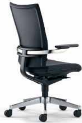
Klöber Orbit orb98 Drehsessel. Glasfaserverstärkter Trägerrahmen mit TPE-Membran. Alu-Rückenlehnenträger schwarz, Alu-Armbügel und -Fußkreuz poliert. Klöber Orbit orb98 swivel chair. Glass-fibre reinforced supporting frame with TPE membrane. Aluminium backrest frame, black, aluminium armrest bars and base, polished.