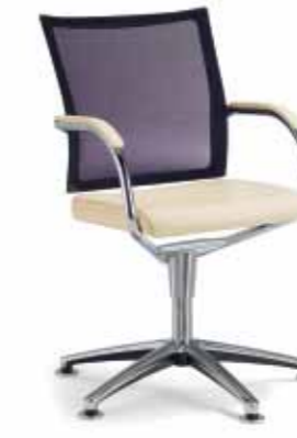
Klöber Orbit Network orb80 Konferenz-Drehsessel auf Gleitern. Softnet-Rückenlehne. Armlehnen mit Kunststoff-Auflage schwarz, Armauflage optional Leder oder Buche. Rundrohr-Gestell hochglanz verchromt. Rückholmechanik. Klöber Orbit Network orb80 conference swivel chair on glides. Softnet backrest. Armrests with black plastic finish, arm supports optionally with leather or beech finish. Tubular steel frame with polished chrome finish. Auto-return mechanism.