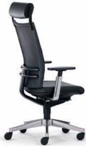
Klöber Orbit orb99 Drehsessel mit neigbarer Kopfstütze. Glasfaserverstärkter Trägerrahmen mit TPE-Membran. Alu-Rückenlehnenträger schwarz, 4F-Armsupports und Alu-Fußkreuz poliert. Klöber Orbit orb99 swivel chair with tilting headrest. Glass-fibre reinforced supporting frame with TPE membrane. Aluminium backrest frame, black, 4F arm supports and polished aluminium base.