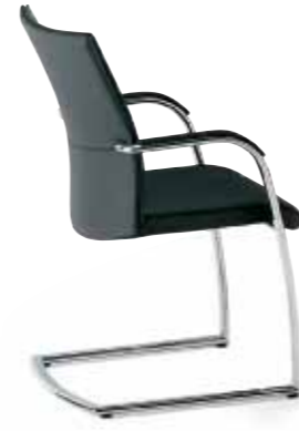
Klöber Orbit orb56 Freischwinger. Rücken vollumpolstert. Armlehnen mit Lederauflage. Ovalrohr-Gestell hochglanz verchromt. Klöber Orbit orb56 cantilever chair. Fully-upholstered backrest. Armrests with leather finish. Oval-tube steel frame, polished chrome finish.