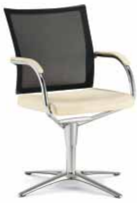
Klöber Orbit Network orb80 Konferenz-Drehsessel mit Softnet-Rückenlehne, Armlehnen mit Lederauflage. Rundrohrgestell hochglanz verchromt. 4-strahliges Fußkreuz alu-poliert, mit Gleitern. Rückholmechanik. Klöber Orbit Network orb80 conference swivel chair with softnet backrest, padded leather armrests. Tubular steel frame with polished chrome finish. With 4-star base in polished aluminium on glides. Auto-return mechanism.