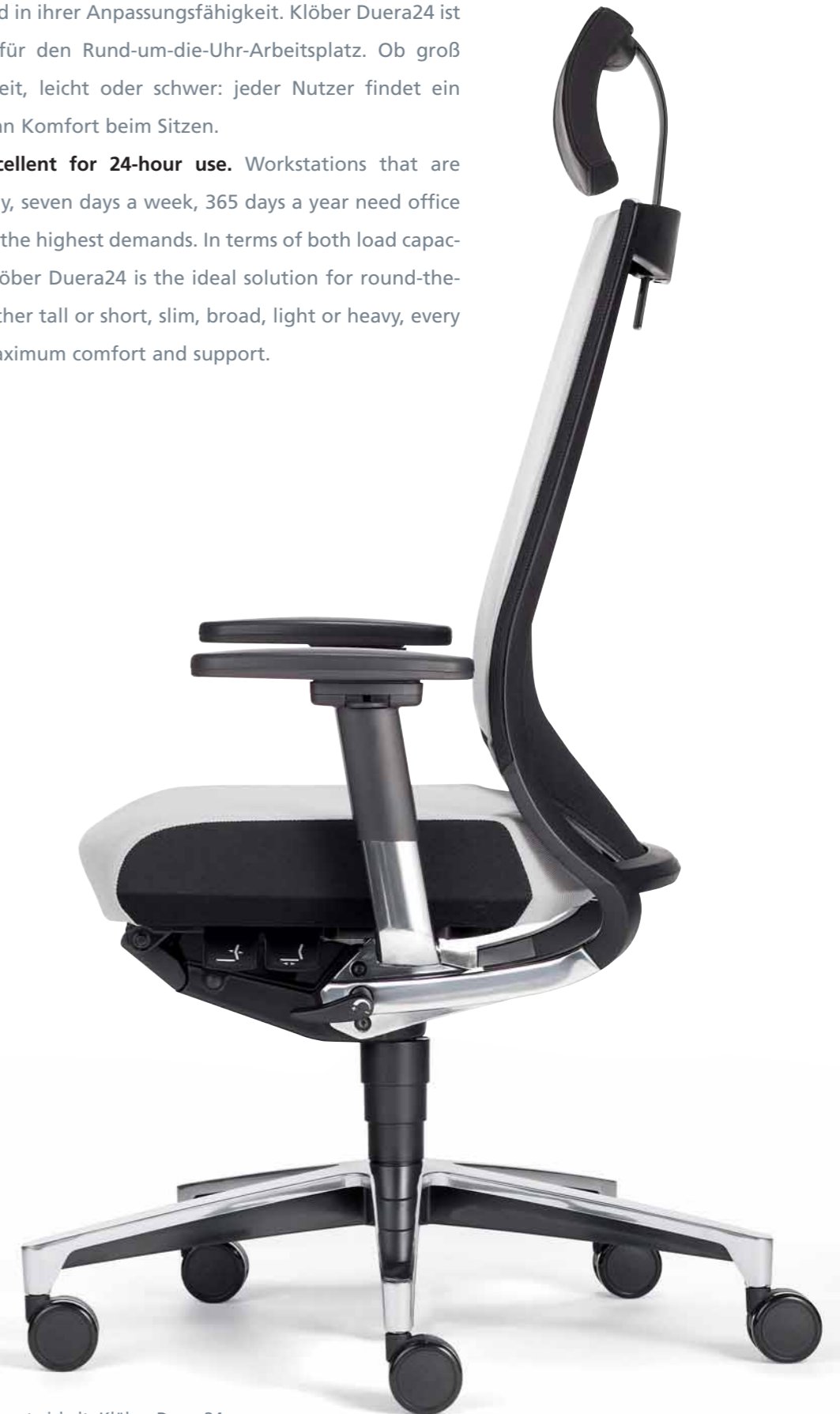
Für den 24-Stunden-Einsatz entwickelt: Klöber Duera24. Klöber Duera24: developed for 24-hour use.

Klöber Duera24 – excellent for 24-hour use. Workstations that are occupied 24 hours a day, seven days a week, 365 days a year need office swivel chairs that meet the highest demands. In terms of both load capacity and adaptability. Klöber Duera24 is the ideal solution for round-the-clock workplaces. Whether tall or short, slim, broad, light or heavy, every user will experience maximum comfort and support.