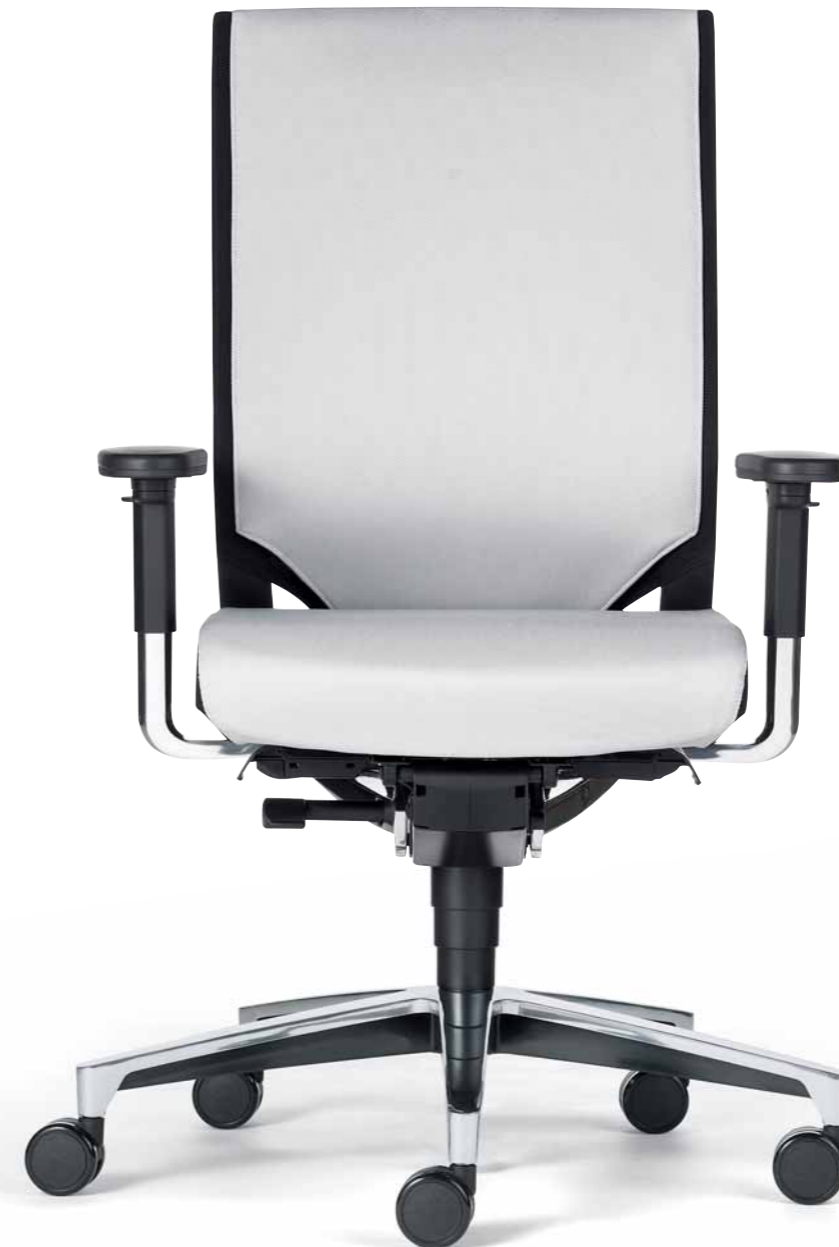
Klöber Duera24 due92 Synchron-Drehstuhl. Netzrücken mit Polsterauflage. 4F-Armsupports mit Stylingkappe. Klöber Duera24 due92 synchro swivel chair. Mesh backrest with padding. 4F arm supports with cover sleeve.