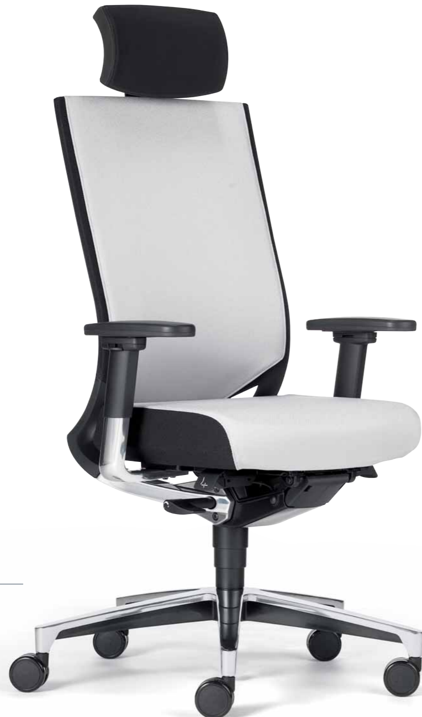
Klöber Duera24 due93 Synchron-Drehstuhl mit Kopfstütze. Netzrücken mit Polsterauflage. 4F-Armsupports mit Stylingkappe. Klöber Duera24 due93 synchro swivel chair with headrest. Mesh backrest with padding. 4F arm supports with cover sleeve.